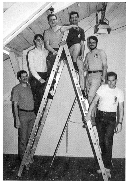
Eine Gruppe des EVU-Handwerker-Teams macht am ersten Samstag eine Pause für den Fotografen.