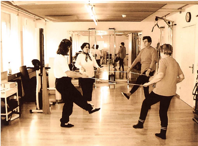
III. 5: Groupe Balance