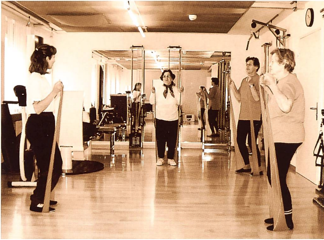
III. 4: Groupe Force (Theraband)