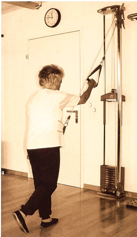
III. 1: Individuel – MTT