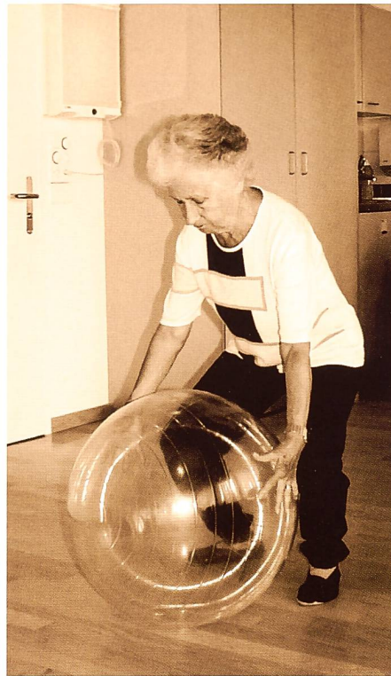
III. 2: Individuel – soulever