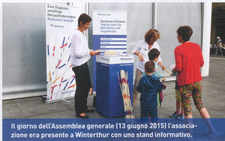
Il giorno dell'Assemblea generale (13 giugno 2015) l'associazione era presente a Winterthur con uno stand informativo.