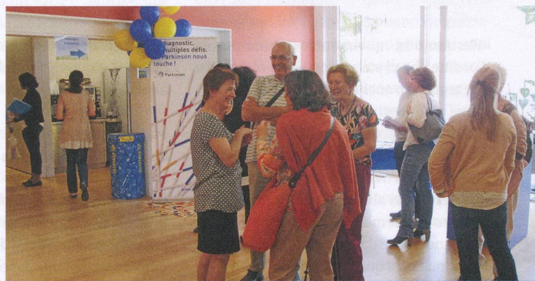
A Losanna l'associazione si è presentata al pubblico il 22 maggio, in occasione delle porte aperte del Site de Plein Soleil.