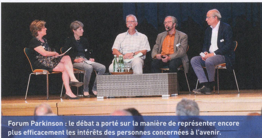
Forum Parkinson : le débat a porté sur la manière de représenter encore plus efficacement les intérêts des personnes concernées à l'avenir.

Conformément à la tradition, Parkinson Suisse changera de lieu pour la prochaine édition de son AG. La 31 e assemblée générale de l'association se tiendra le samedi 11 juin 2016 à Fribourg. jro