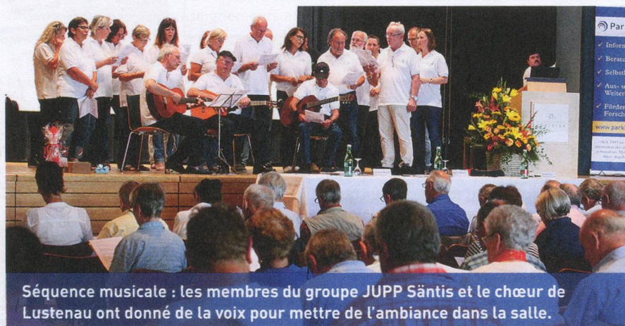
Séquence musicale : les membres du groupe JUPP Sântis et le chœur de Lustenau ont donné de la voix pour mettre de l'ambiance dans la salle.