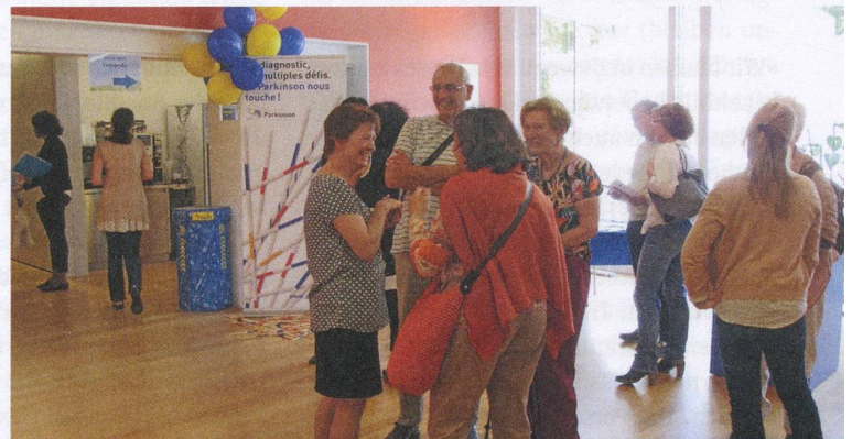
In Lausanne trat die Vereinigung am 22. Mai bei den Portes ouvertes in der Site de Plein Soleil an die Öffentlichkeit.