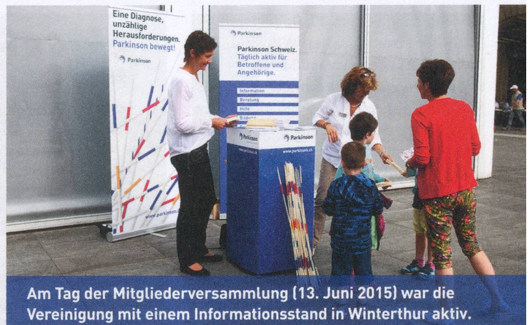
Am Tag der Mitgliederversammlung (13. Juni 2015) war die Vereinigung mit einem Informationsstand in Winterthur aktiv.