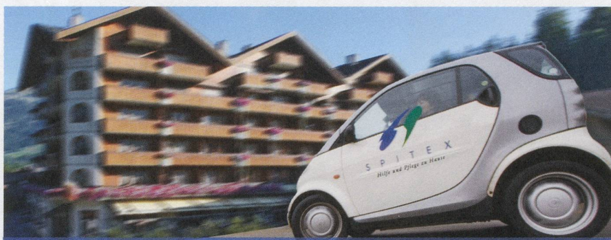
Für hilfsbedürftige Gäste kommt die Spitex während der Ferien auch ins Hotel.