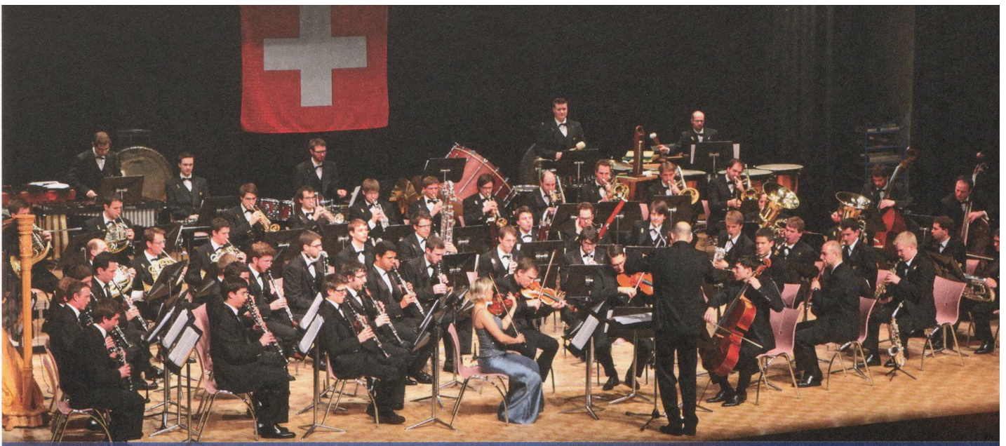
Das Symphonische Blasorchester Schweizer Armeespiel und das AMAR Quartett gaben zwei Konzerte für Parkinson Schweiz.