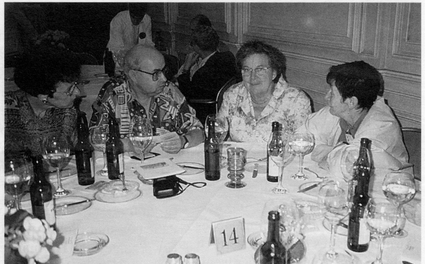
An runden Tischen wurde lebhaft diskutiert / Les tables rondes étaient animées par les discussions