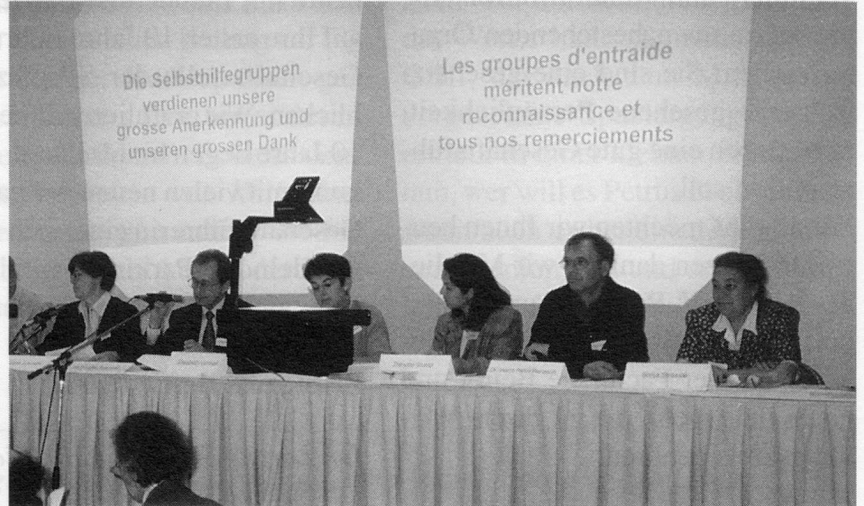
Der Dank des Vorstandes an die Selbsthilfegruppen / Les remerciements du Comité aux groupes d'entraide