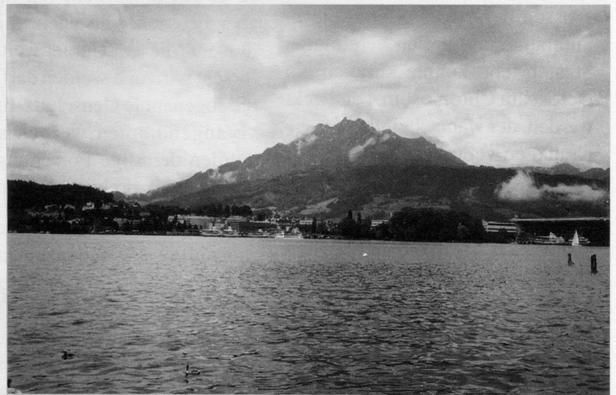
Nur der Blick durchs Fenster passte nicht zur frohen Stimmung / La vue, cependant, ne se présentait pas d'une manière gaie