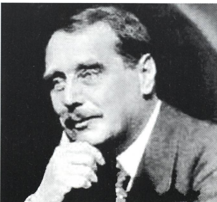
Fig. 2.: Herbert George Wells (1866-1946).

Quant à HERBERT G. WELLS (Fig. 2), il fut certes romancier, mais aussi journaliste, sociologue et historien populaire.