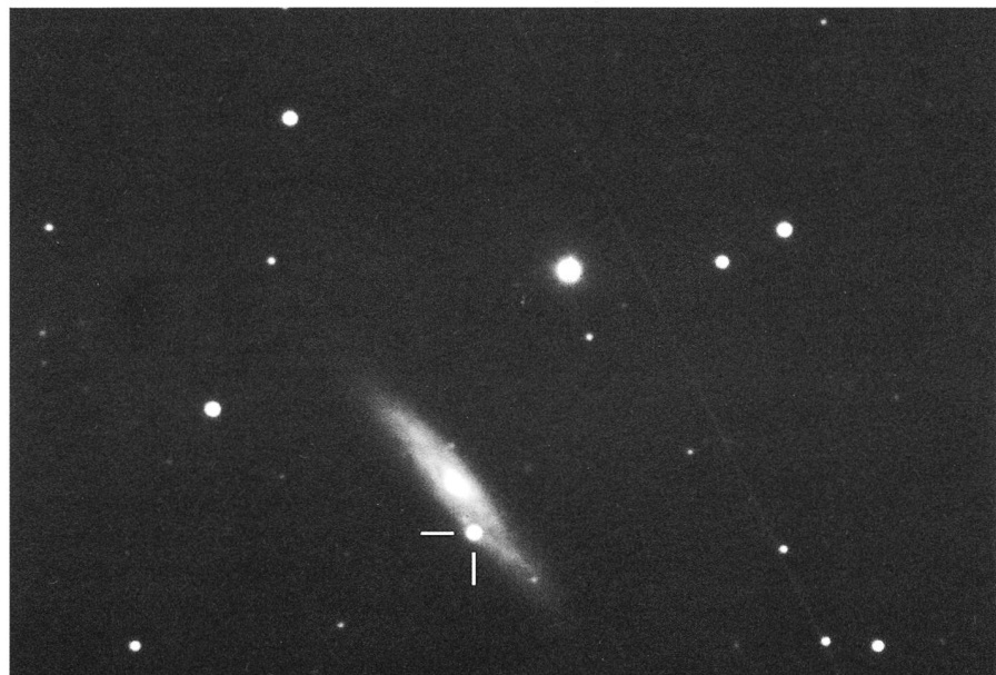
SN 1998 S