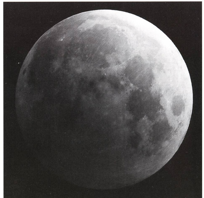
Der voll in den Erdschatten eingetauchte Mond, um ca. 4.20 Uhr MESZ fotografiert durch das 250/2000mm-«Friedrich-Meier»-Teleskop der Sternwarte Eschenberg. Belichtung: 10 Sekunden auf Kodacolor 200. Beachte auf der linken Seite die beiden Lichtpunkte von SAO 109078 (6.9 m) und SAO 109084 (7.4 m).