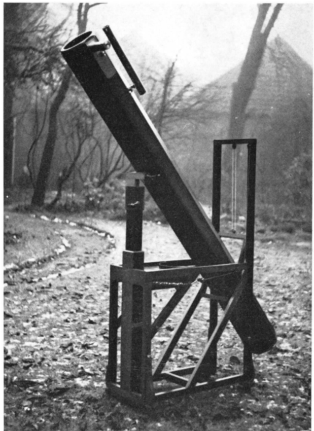
Abb. 3: 7 Fuss-Teleskop für Dr. VAN MARUM (B-14). Teyler's Museum Haarlem.

Brennweite 2.2 Meter, Hauptspiegeldurchmesser ca. 15 cm. Verkauft an Dr. VAN MARUM, Haarlem, Holland. Abb. 3 zeigt dieses Teleskop, es ist heute in komplettem Zustand in Teyler's Museum, Haarlem, ausgestellt. Zum Instrument gehören 8 Okulare.