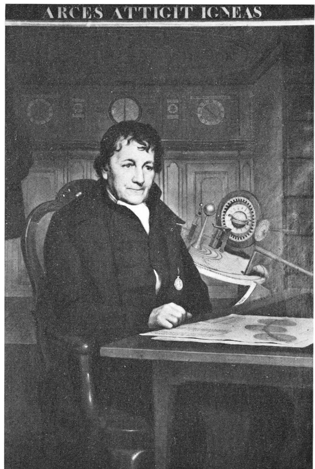
Bildnis von EISE EISINGA (1744–1828) durch WILLEM BARTEL v. D. KOOL.

ren und Saturn in 29.46 Jahren. Die drei Planeten: Uranus, Neptun und Pluto waren ja zu der Zeit, als EISINGA an seinem Planetarium arbeitete, noch nicht entdeckt. Uranus wurde allerdings noch zu seinen Lebzeiten gefunden, nämlich im Jahre 1781.