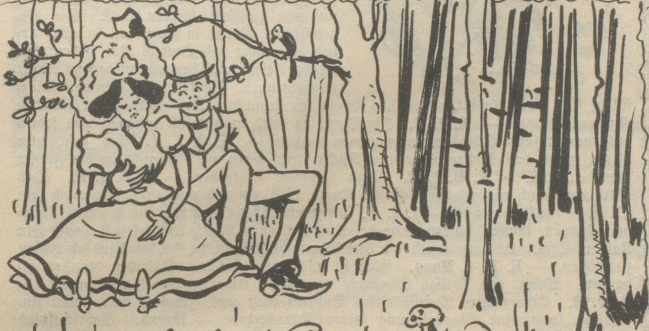
3-Dann im Himmel gesessen