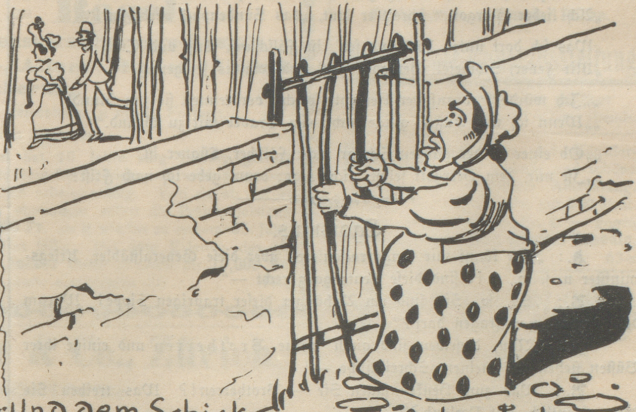
2-Und dem Schicksal getruft