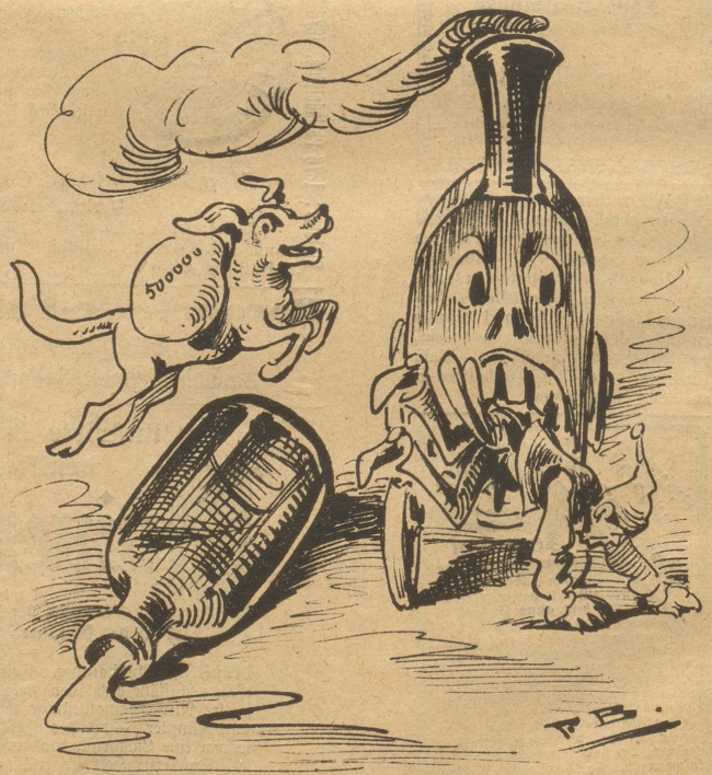
Wenn der Hund mit dem Geld über'n Schnaps wegspringt Und die Bahn das Volk und den Bund verschlingt.