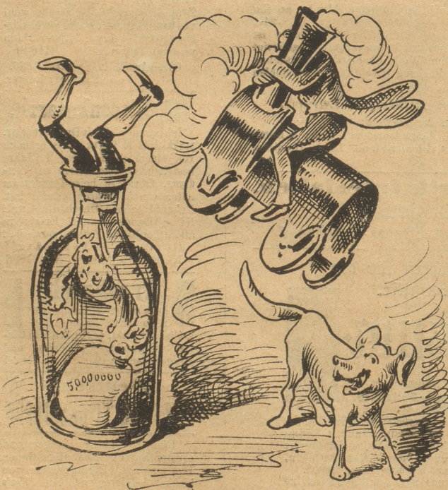
Wenn die Bahn mit dem Bund über'n Hund wegspringt Und der Schnaps das Volk und das Geld verschlingt —