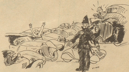
Die Saison beginnt!

«Entschuldiget, ich han i dene Jahre au verschiedenes vergässe ....»