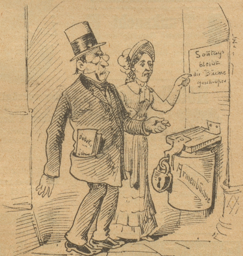
kein Wohlthäter gebuhlet;