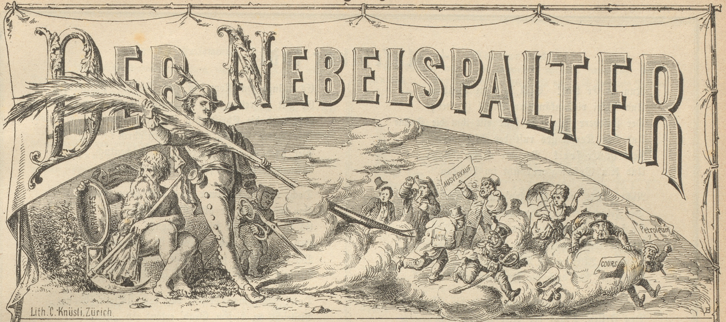
Lith. C. Knüsli, Zürich.