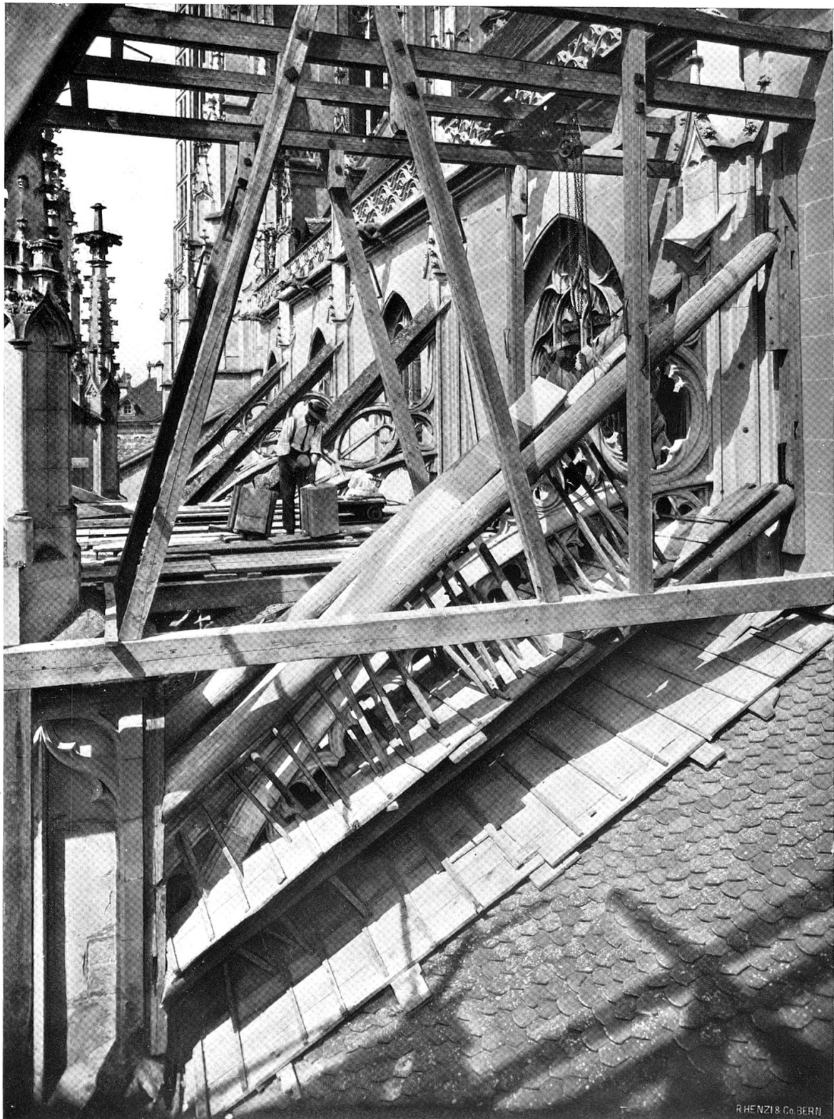
Neuer Strebebogen während des Versetzens