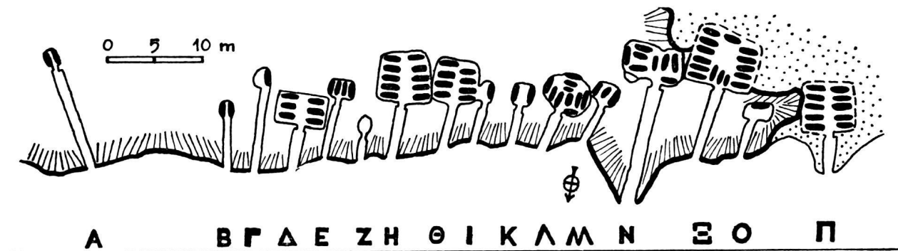
Fig. 2. La nécropole de Mazarakata (d'après P. Kavvadias).

en revanche, fondée sur une identification qui ne laisse guère de place au doute, elle présente un haut degré de probabilité. Mais, pour que cette probabilité se mue en certitude, il reste encore à montrer que les fouilles pratiquées à Mazarakata, loin d'exclure la possibilité d'une première exploration du site vers 1812, rendent au contraire inéluctable la conclusion vers laquelle nous nous sommes acheminé.