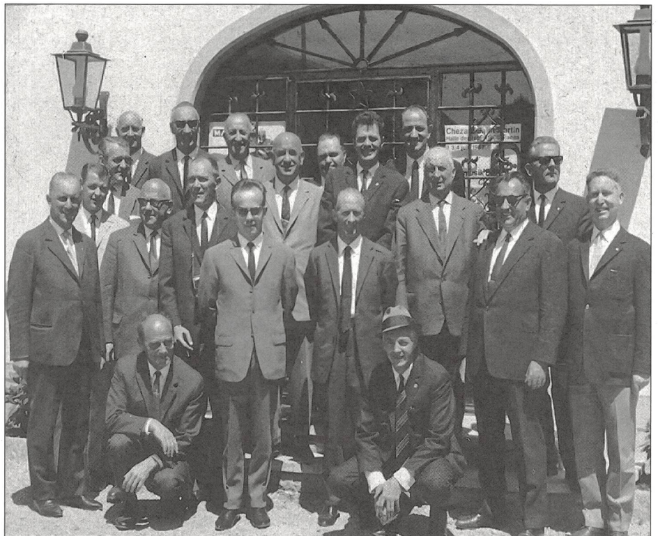
Gli entusiasti membri del SRI riuniti per una conferenza in Romandia.

rinnovatore dei Giochi olimpici dell'era moderna) a un'attività ginnica postscolastica «volontaria» dai 14 anni ai 20 (oggi, 1994, dai 10!). Già negli anni d'inizio (un «apprendistato» anche per i dirigenti) nel Canton Ticino si registrarono risultati abbastanza soddisfacenti: 1000 giovani (l'IP era riservata soltanto ai maschi fino a che non venne G + S) parteciparono ai primi corsi (567 condizioni soddisfatte); 1'117 lo furono nel 1943 (685); 1'191 nel 1944 (861); poi (fine della guerra) iniziò un leggero calo con ripresa continua dal 1947. Un'attività semplice, adatta a tutti, che andò man mano arric-