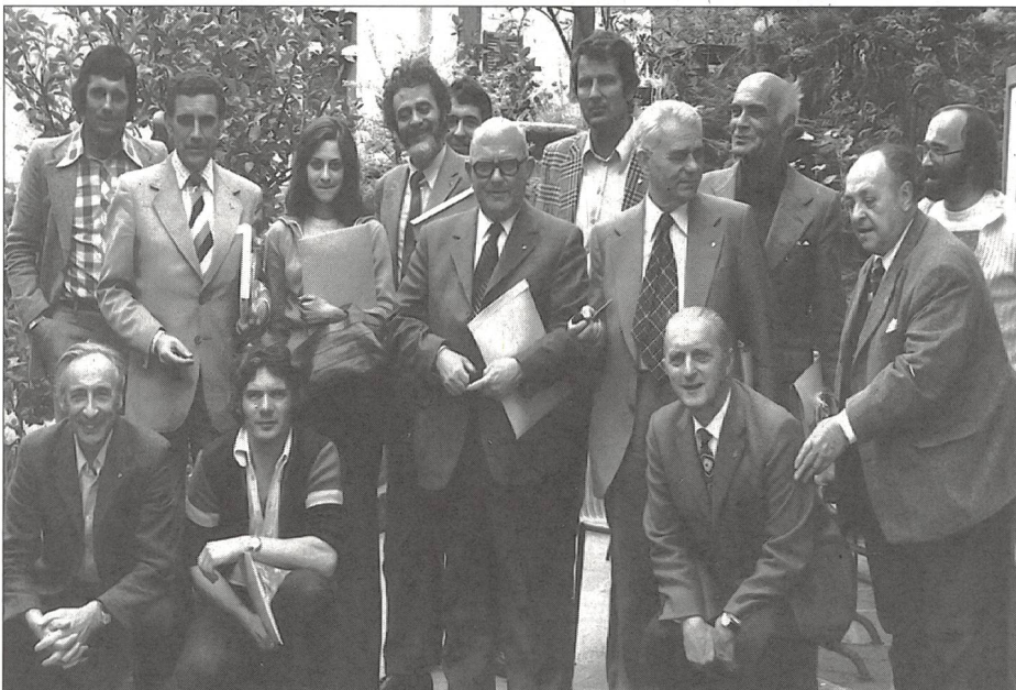
Un bel gruppo di amici del SRI, stavolta riuniti nel Ticino, con escursione ... gastronomica a Monticello.

In provenienza dal giornalismo sportivo professionistico, posso affermare che «l'accoppiata» si è rivelata azzeccata e oltremodo fruttuosa in quanto il movimento, subito compreso dai colleghi della stampa scritta e parlata (la TV venne più tardi a inserirsi con noi) e ogni comunicato o papiro trovarono sempre ospitalità (oggi, un po' meno, dato che il grande spazio che, nei quotidiani, è invaso dagli impensati sviluppi che ha assunto lo sport in tutte le sue espressioni). E quando, nel