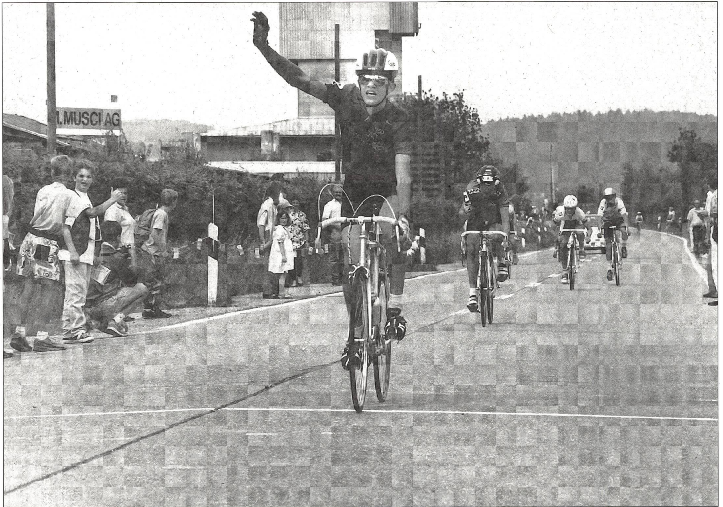
Sprint finale come tra i grandi campioni: impegno, stile e attrezzatura non fanno una grinza.

denominata "campionato svizzero per scolari". Il campionato suddivide i partecipanti per anno d'età: i 12enni, 13enni e 14enni gareggiano così con i loro coetanei. Grazie alla crescente partecipazione, a volte vengono stilate delle classifiche separate per le ragazze. Per mettere in rilievo il ruolo del ciclismo come sport di squadra, un accento particolare è posto sulla classifica a squadre. Per ogni anno di età vengono presi in considerazione i due partecipanti meglio classificati di ogni scuola di ciclismo. Inizialmente nelle classifiche generali prevalevano le scuole di Wohlen, Gansingen e Affolter am Albis, mentre negli ultimi anni quelle di Sulz (Argovia) e Wetzikon. Ma com'è strutturato il campionato annuale? Da maggio a settembre vengono svolte sei gare e si tiene conto delle migliori quattro. Ogni gara è suddivisa in tre parti, che vengono valutate con la medesima importanza: