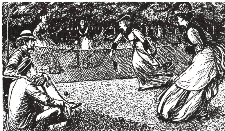
Doppio femminile nel 1874 (da Clerici 1979, 65)

Le referenze bibliografiche possono essere richieste presso la redazione. ■