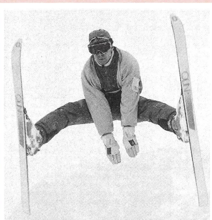
In copertina: Un bel balzo acrobatico nell'anno nuovo!