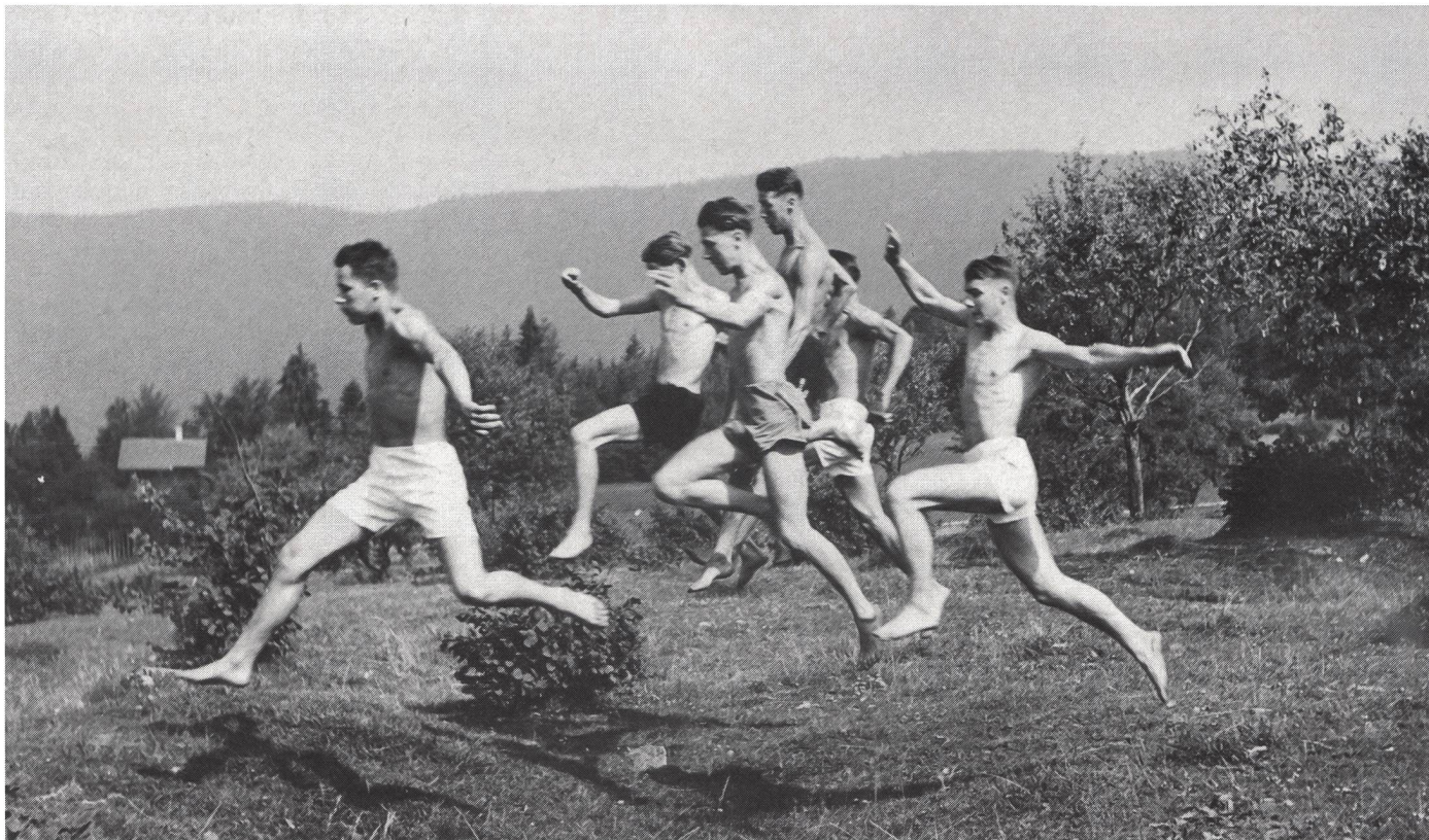
Lo sviluppo dei fattori condizionali è alla base di ogni processo d'apprendimento.

comunque da sempre, quanto per non rimanere immobili ed insensibili al progresso. Anche gli allievi ne intuiscono l'importanza e vengono influenzati positivamente. Sottoponendoli infatti a prove come «il Test di Conconi» o il «Test con intervalli di Probst» e comunicando loro i risultati (knowledge of results) con le varie possibilità di allenamento, si sentiranno particolarmente motivati, conosceranno i limiti del loro corpo. Questa motivazione però mi sembra poco pronunciata tra le ragazze. Già dall'infanzia la nostra società contribuisce a differenziare il comportamento del bambino da quello della bambina. Prendiamo ad esempio il significato del pianto. Se una bambina piange si dice: «su non piangere fai la brava». Ma se piange un bambino, allora gli si dice: «Cosa vedo, un uomo che piange? Vergogna!» Viene subito creata una determinata immagine della donna ed un ben definito quadro dell'uomo. Anche ad una donna adulta è permesso piangere in pubblico, meglio ancora se bella. Fino a poco tempo addietro, per l'uomo, piangere in pubblico rappresentava una vera onta.