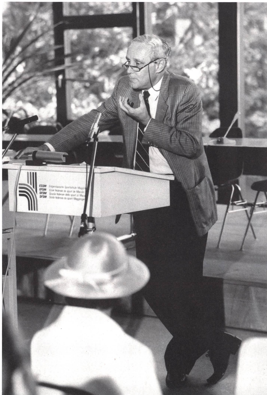
Lo sport assume un significato esistenziale.

Il sistema scolastico svizzero ha tenuto conto delle loro considerazioni e i cantoni hanno dato una crescente importanza all'insegnamento dello sport nelle scuole. Lo sport è la sola materia scolastica sottoposta al diritto federale, il quale determina il numero minimo di ore d'insegnamento