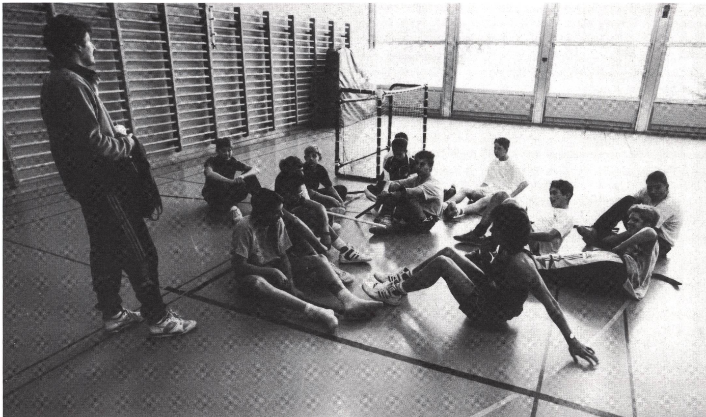
Cercare il contatto con gli allievi per un'intesa ottimale.

ve assolutamente essere il più «forte» in palestra, deve però essere in grado di seguire da vicino i propri allievi, per cui è importante dare uno sguardo con occhio critico alla propria efficienza fisica.