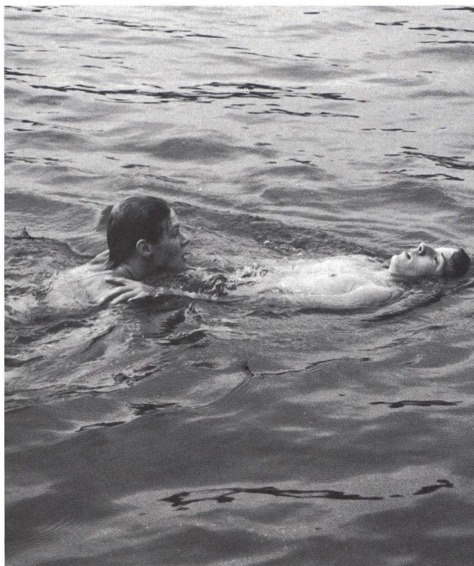
Nuoto di trasporto praticato dai giovani