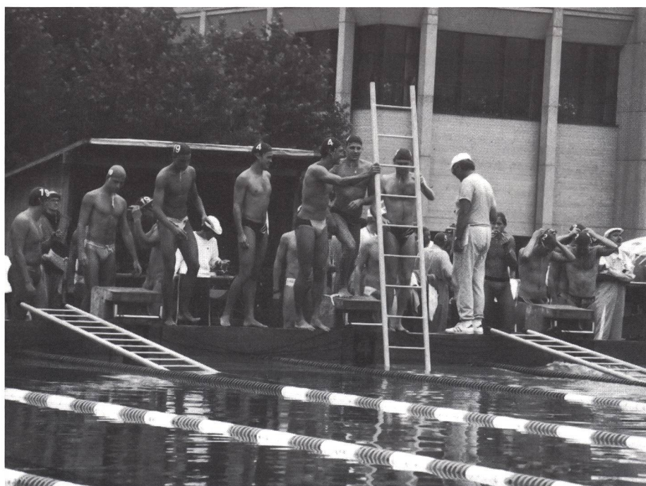
Pronti per la partenza

Le gare, compresi i campionati svizzeri, non hanno come obiettivo quello di intraprendere una caccia al record o di spingere i concorrenti al limite delle loro possibilità, ma di organizzare dei raduni amichevoli tra le varie sezioni, ciò che valorizza quindi la prestazione della squadra. Non esistono né classifiche né liste di record!