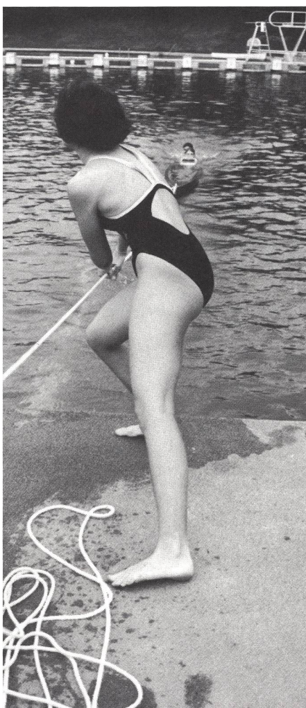
Donne durante una staffetta con la tavola e la corda di salvataggio

Quando sono in possesso del brevetto di giovane salvatore, i ragazzi e le ragazze possono partecipare, a partire dagli 11 anni, alle attività del nuoto di salvataggio. L'integrazione nella squadra, il funzionamento degli attrezzi di salvataggio, la scoperta del mondo sottomarino reso possibile dall'equipaggiamento di immersione ABC, la parte di avventura legata al nuoto (laghi e fiumi), così come l'apprendimento del soccorso e del salvataggio sono elementi che incitano i giovani alla pratica con entusiasmo di questa specialità.