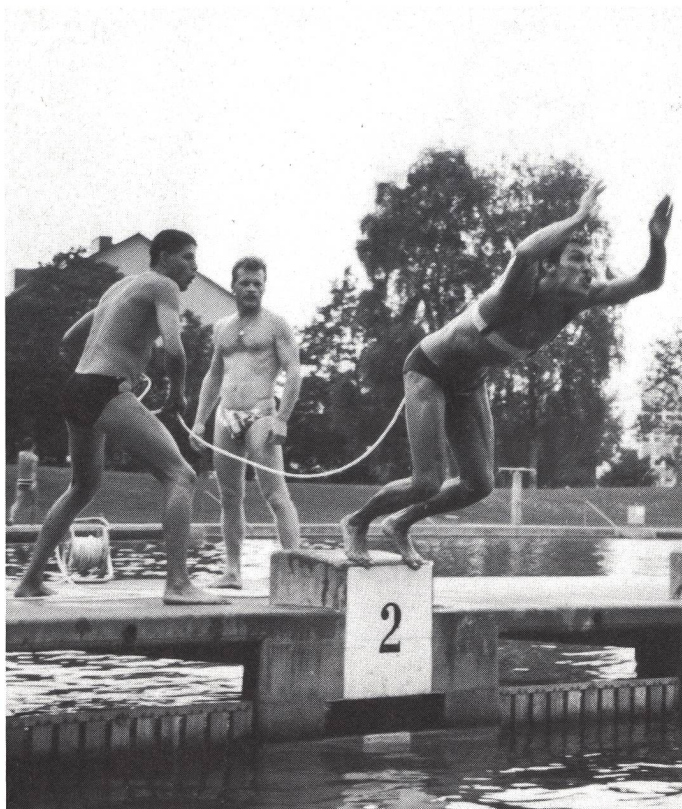
Partenza della staffetta con corda e cinghia