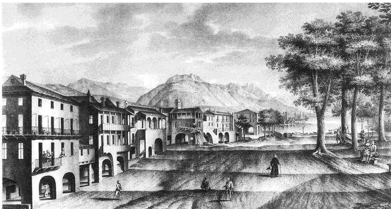
1 La parte orientale della città con la riva ed i primi «giardini». Particolare tratto dal secondo di due disegni dedicati a Locarno dal prefetto basilese Federico Leucht negli anni 1766–1768. (Locarno, Municipio)

tavano, con la loro natura «addomesticata», un passaggio graduale, una zona tampone, tra la città e la natura «selvaggia» dei Saleggi (com'era chiamato il delta).