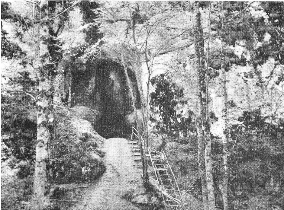
Eingang zur neuentdeckten Kohlerhöhle im Kaltbrunnental.

Abgraben des Schuttes im Abri auch von aussen begonnen werden. Als hier die Kulturschicht einmal erreicht und in Angriff genommen war, konnte an ein Deponieren dieses Materials nicht mehr gedacht werden. Um aber auch die kleinsten Funde noch aus dem Kulturschichtmaterial heraus zu bekommen, erwies es sich als notwendig, das Material zu schlämmen. War uns der