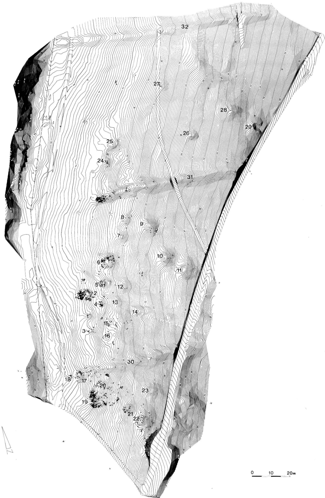
Abb. 1. Stälzler, Lampenberg BL. Topographischer Plan des Fundgeländes. 1–29 Hügel; 30–32 Wälle; kleine Kreuze: Oberflächenfunde 1991. Äquidistanz der Höhenlinien: 0.10 m. Topogr. Aufnahme: W. Huber; Automat. Kartierung: Geocad AG, Liestal.