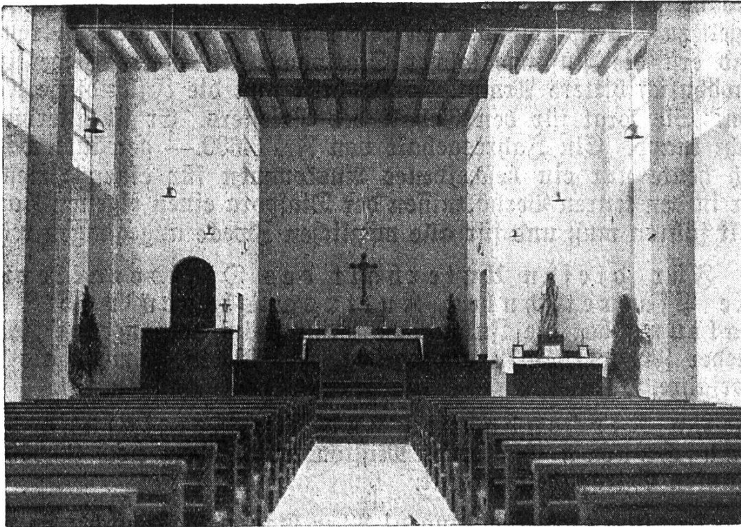
Katholisches Kirchlein in Affoltern b. Zürich (Inneres).

Das sind die neuen Werke aus dem Berichtsjahr 1928. Es sind Wohnstätten des eucharistischen Heilandes in einer glaubensarmen Welt — sind Gnadenstätten für arme, zerstreute Glaubensbrüder — auf viele Jahre.