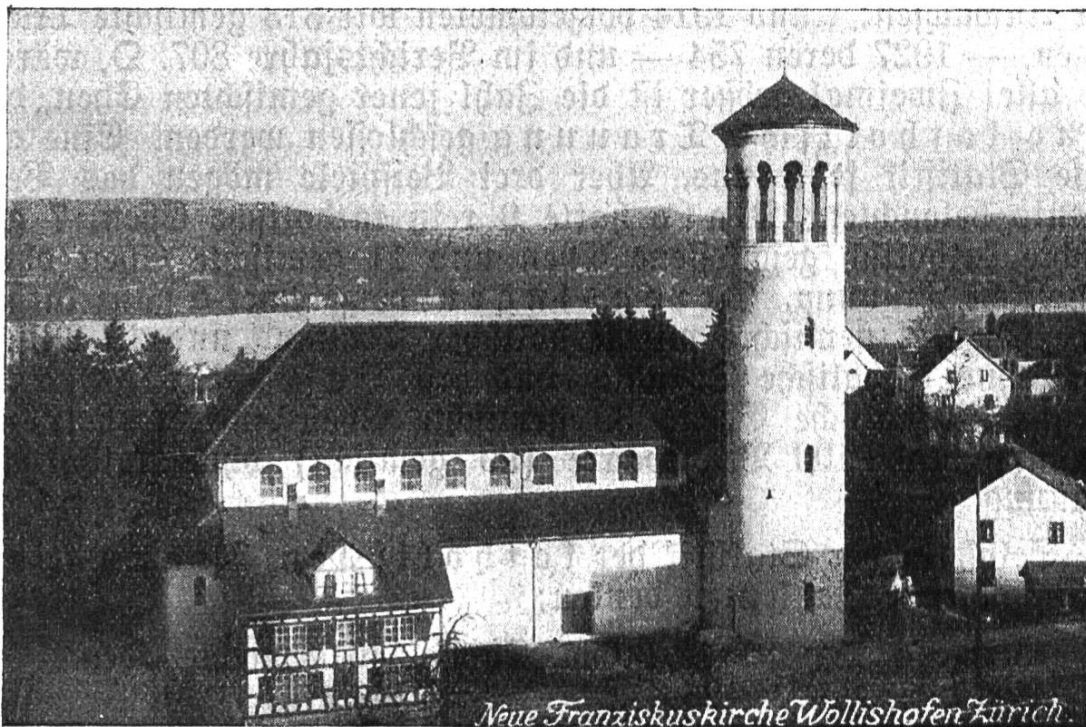
St. Franziskus-Kirche Wollishofen.

Es muß aber zur Ehre der eigentlichen Diaspora-Katholiken gesagt werden, daß die Mehrzahl dieser Unglücklichen nicht aus ihren Reihen stammt. Die aus katholischer Gegend neu Zugewanderten fallen vielfach der ungläubigen Umgebung und ihrem unglaublichen Leichtsinne zum Opfer. Dieser traurige Abfall kommt selten dem gläubigen Protestantismus zu gut, mehrt aber das große Heer der Ungläubigen und die unheimliche Zahl der Ehescheidungen.