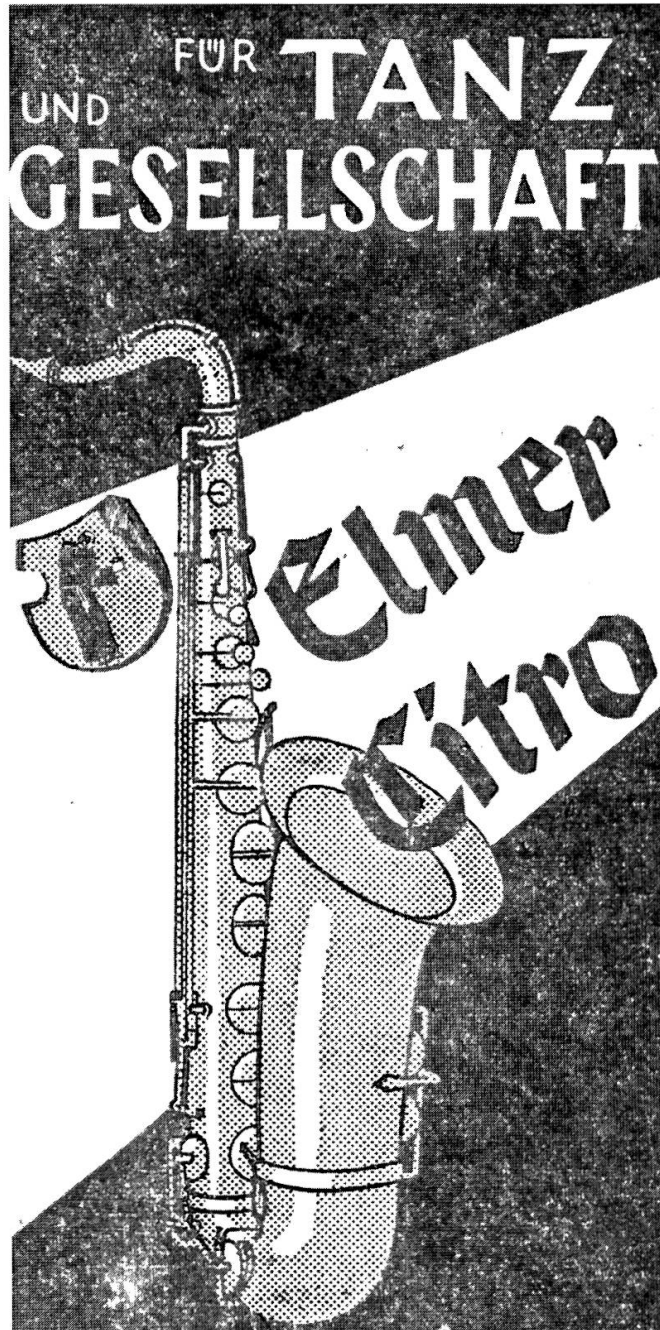
30. Dezember 1930: Inserat Elmer Citro: Für Tanz und Gesellschaft.

krumme Rücken, rasselnde Telephone, Schreiten über Teppiche, silberfunkelnde Speisesäle, Tennisplätze, Kodaks, Bergesgipfel, Kartengrüsse, weisse Hemdbrüste, suchende Augen, Geständnisse, Versprechungen, Spleens, Jazz!» 2