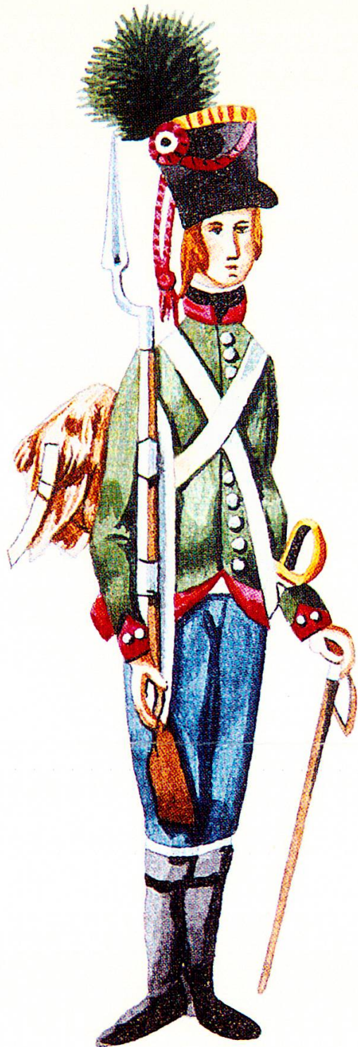
Glarner des eidgenössischen Kontingents anlässlich der Grenzbesetzung von 1805 in der Uniform des ehemaligen Regiments von Bachmann (1799–1801). Originalgetreue Kopie von Hans Brüttsch, Köniz, aus der Serie «Altes Zeughaus» im Landesmuseum Zürich, unbekannter Zeichner.