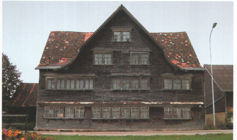
1 Trotz Schutzverfügung ist der «Löwen» in Schwarzenbach SG seit über 20 Jahren dem Verfall preisgegeben.

Ehemaliges Restaurant mit Bäckerei Löwen, 1688/89 Wilerstrasse 55, Schwarzenbach