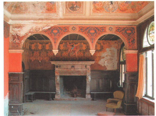
3 Das Resultat des Fantasie-Stilmixes ist so aussergewöhnlich, dass der Heimatschutz sich für die Rettung einsetzt.