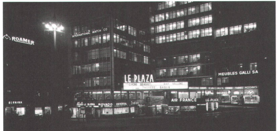
1 Das Genfer Kino «Plaza» ist Teil des Mont-Blanc-Centre. Letzteres wird renoviert. Das Kino ist deshalb seit Monaten geschlossen.

Cinéma Plaza, 1951–1953 Rue de Chantepoulet 1–3, Genf