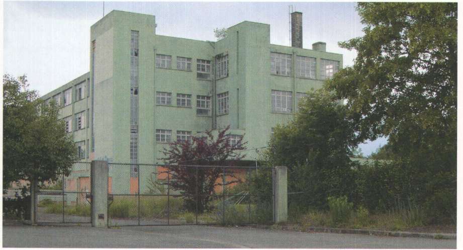
1 Lindgrün die Fabrikfassade, lindgrün die Schachteln der Schuhe von Hug in Dulliken. Jetzt sucht die Fabrik neue Nutzer.

Schuhfabrik Hug, 1932/33 Industriestrasse 52, Dulliken SO