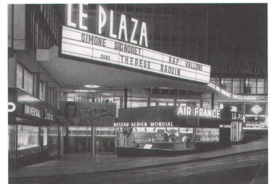
2 Der Bau aus den Fünfzigerjahren von Marc-Joseph Saugey ist fast integral erhalten. Er wurde zum Kinovorbild.