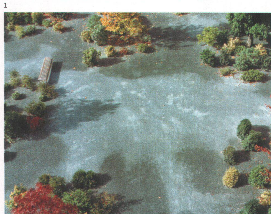
1 Der Garten liegt über einer Stützmauer beim Bahnhof. Die Erweiterung nach Norden soll bald realisiert werden.