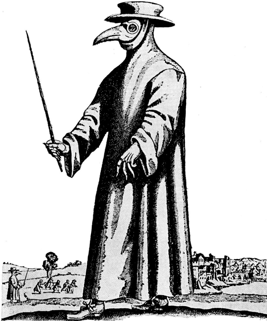
Arzt in Schutzkleidung gegen die Pest. Nach einem Stich aus dem Jahre 1656