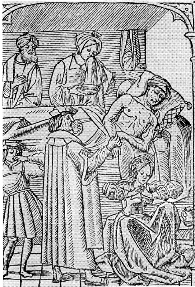
Arzt bei der Visite eines Pestkranken Anonymer Holzschnitt aus dem Jahre 1512