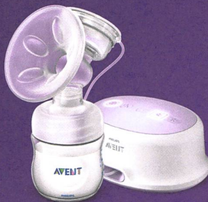
Tire-lait électrique Natural