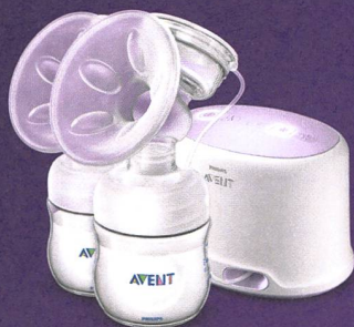
Tire-lait double électrique Natural

Les tire-lait Natural de Philips Avent ont été développés en collaboration avec les meilleurs spécialistes de l'allaitement en prenant exemple sur la nature. Ils permettent aux mamans de tirer leur lait de façon beaucoup plus confortable ce qui favorise la lactation.