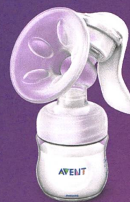
Tire-lait manuel Natural