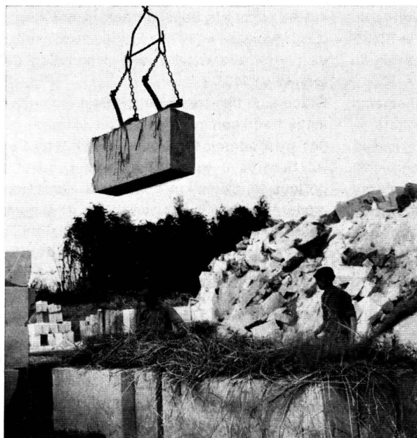
Transport de pierres tendres prétaillées.

sphère industrielle, et qui les enrichisse de la couleur et de la vie comme seul peut le faire un matériau naturel, un parement qui, en un mot, les habille et cela à l'épreuve du temps.