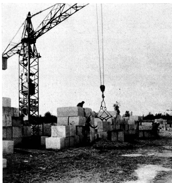
Transport de pierres tendres prétaillées.

A côté de la pierre de taille largement employée, l'architecture moderne orientée vers un style dépouillé utilise également pour les murs porteurs: le béton, la brique, le métal... Ces derniers appellent un parement qui protège contre le bruit, la chaleur, le froid, les poussières, l'atmo-