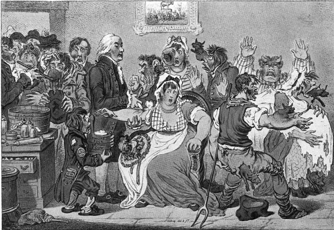
Abb. 1. J. Gillary, Dr. Jenner impft das britische Volk, sitzend Britannia, rechts hinten John Bull. Aus: Eugen Hollaender, Die Karikatur und Satire in der Medizin . Stuttgart 1905, 295.

ten Umwelt auch auf die sozialen Beziehungen. Die ärztliche Kompetenz reichte nun bis in die Gemächer der Menschen. 39