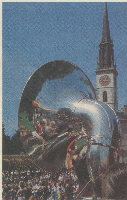
Jour de fête à Cham.

Cinq kilomètres après Zoug, en direction de Zurich, je me suis ensuite arrêté du côté de Baar (prononciation inchangée en français!). Juste au-dessous du «Tobelbrücke», un chemin mène aux fameuses grottes de l'enfer. Ce sont des ouvriers travaillant à l'extraction du tuf, qui découvrirent par hasard ces grottes, au siècle passé. A proximité d'un superbe restaurant, où l'on sert les spéciali-