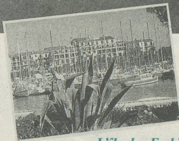
L'île des Embiez