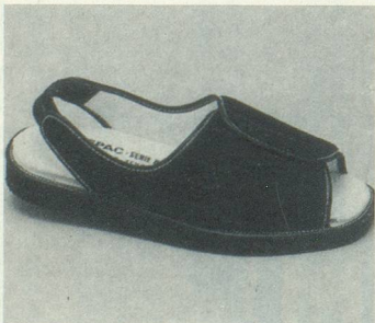
FORMEN N°1 Marine Fr. 77.-

(Veuillez indiquer le nombre de paires dans les cases correspondantes, s.v.pl.)