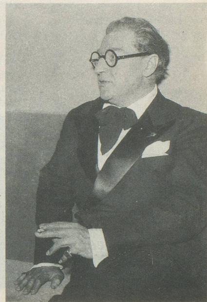
Sacha Guitry, plus de 100 pièces et 33 films.