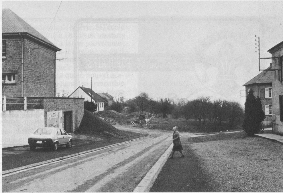
Stonne, 39 habitants. Napoléon III y a couché!

» Je vis aujourd'hui toute seule, après m'être occupée de mes parents et de deux oncles, jusqu'à la fin. Je conduis toujours ma Dyane, mais j'évite les encombrements des villes. Le car ne