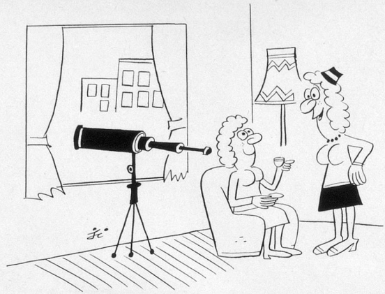
— Alors, quoi de neuf dans le quartier? (Dessin de Burnet-Cosmopress)