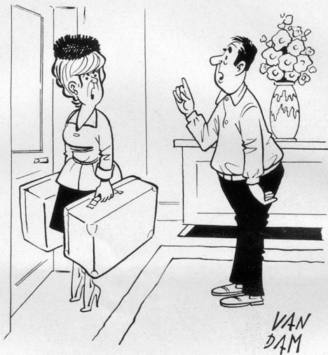
— C'est définitif... Je retourne chez ma mère! — Alors n'oublie pas de dire à ton pauvre père qu'il peut venir se réfugier ici! (Dessin de Van Dam-Cosmopress)

00/00003 BIBLIOTHEQUE NATIONALE 3003 BERNE