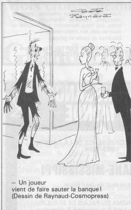
— Un joueur vient de faire sauter la banque ! (Dessin de Raynaud-Cosmopress)