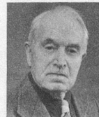
par André Chabloz