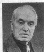
par André Chabloz