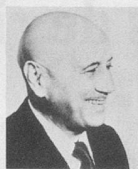
par Jean Nohain